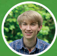
Till Zeyn Geographie